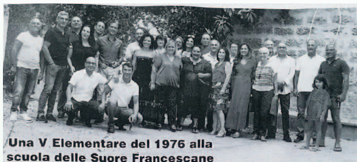
Una V Elementare del 1976 alla scuola delle Suore Francescane