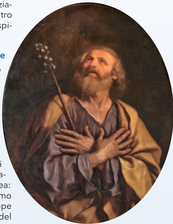
“San Giuseppe con bastone fiorito” del Guercino

Un'altra tradizione narra di una discussione tra il santo e due suoi amici, circa la scoperta della gravidanza di Maria. Poiché egli aveva raccontato l'evento soprannaturale e non era stato creduto, alla sua insistenza gli venne risposto che gli avrebbero creduto solo se il suo bastone fosse fiorito. Ed all'istante il prodigio si compì. Non a caso fiorirono gigli, che sono tradizionalmente associati alla purezza. 7