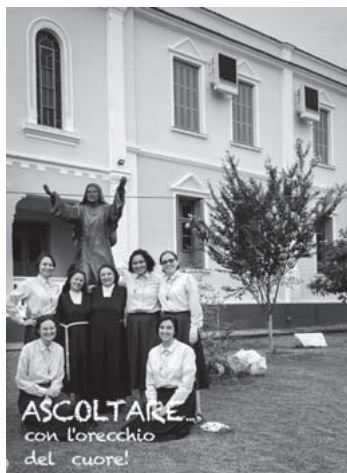
In copertina: Grafica di Suor M. Shereen Abbassi